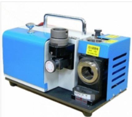
บริษัท เค.ที.เอส. สาร์จเวอร์ กู๊ดส์ จำกัด 0-2755-6338, 0-2088-6158