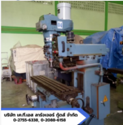
บริษัท เค.ที.เอส. สาร์จเวอร์ กู๊ดส์ จำกัด 0-2755-6338, 0-2088-6158